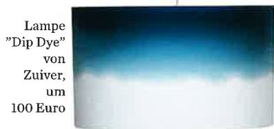
Lampe "Dip Dye" von Zuiver, um 100 Euro